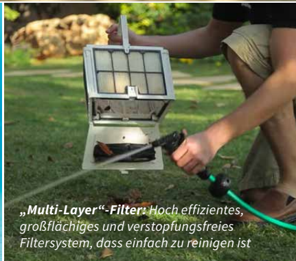
„Multi-Layer“-Filter: Hoch effizientes, großflächiges und verstopfungsfreies Filtersystem, das einfach zu reinigen ist