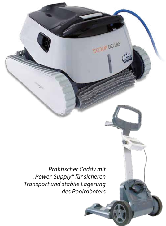
Praktischer Caddy mit „Power-Supply“ für sicheren Transport und stabile Lagerung des Poolroboters

Ausgelegt auf einfachsten und somit zeitsparenden Wartungsaufwand ist die Filtereinheit problemlos über eine zentrale Wartungsklappe von oben her zugänglich.